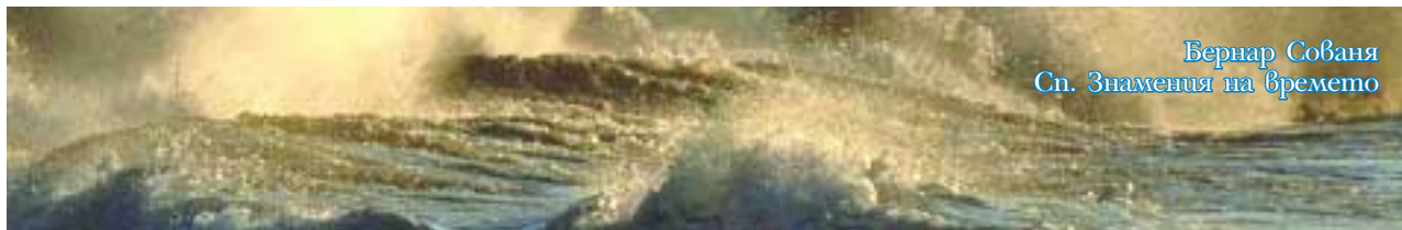
Бернар Сованя Сп. Знамения на Времето

Споре г библейските разкази израелският народ не е пътувал по море. Огромните водни пространства по-скоро са го притеснявали, отколкото да му внушават сигурност. Библията представя морето като елемент, внушаващ страх, но и като такъв със силна духовна стойност, когато Бог го укротява.