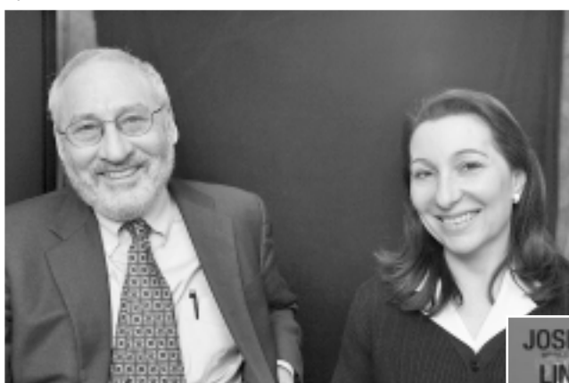
Световноизвестните икономисти Джоузеф Стиглиц и Линда Билмс написаха заедно книгата „Войната за три трилиона долара“.

Но и това не е всичко. Подготвяйки се за двете скъпи войни на Изток, президентът Буш намали... данъците. Тъй като не разполага със средства за военните операции, правителството прибегна до заеми. Към 2017 г. само лихвите по тях ще достигнат 1 трилиона долара. Тези дългове ще се изплащат от цели поколения американци.